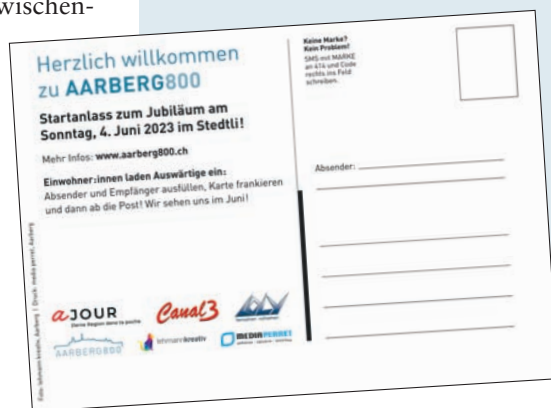
Die AARBERG800-Postkarte zum Startanlass

Die beiden Postkarten in dieser Ausgabe bewerben den Startanlass. Obwohl sich die Karte auch in den eigenen vier Wänden sehen lässt, wäre es schön, wenn die eine oder andere Karte den Weg in einen Briefkasten ausserhalb von Aarberg findet. Vielleicht sogar ergänzt mit einer persönlichen Widmung? Wir danken allen Aarbergerinnen und Aarbergern für die Unterstützung und Verbreitung der Postkarten.